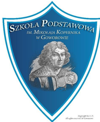
Logo Szkoły Podstawowej im. Mikołaja Kopernika w Goworowie

Szkoła Podstawowa im. Mikołaja Kopernika jest posiadaczem logo, które podkreśla bogatą tradycję, patrona i wizerunek szkoły. Służy celom reprezentacyjnym oraz informacyjno-reklamowym, a także wykorzystywane jest we wszelkiego rodzaju korespondencji wychodzącej ze szkoły i na szkolnej stronie internetowej.